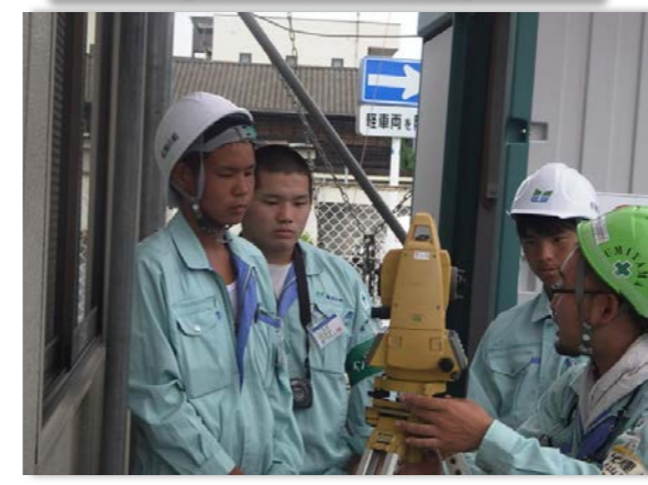
【インターンシップ実習】