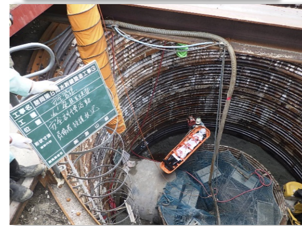
【災害避難訓練の実施】