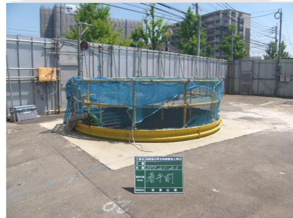
【着手前 No.1 発進立坑部】