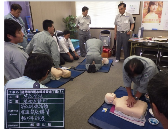
【消防局指導のもと救命講習の実施】