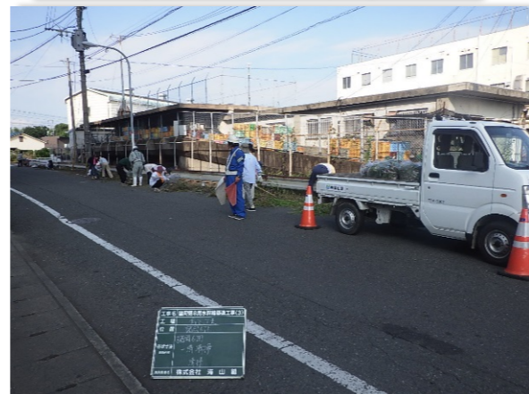
【地域一斉清掃への参加】