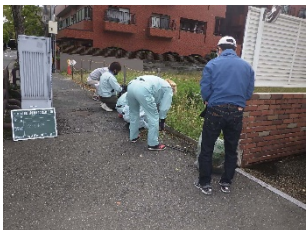
現場周辺の清掃・除草活動