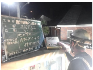
常時通話機の使用