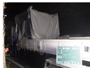
防音シートの活用